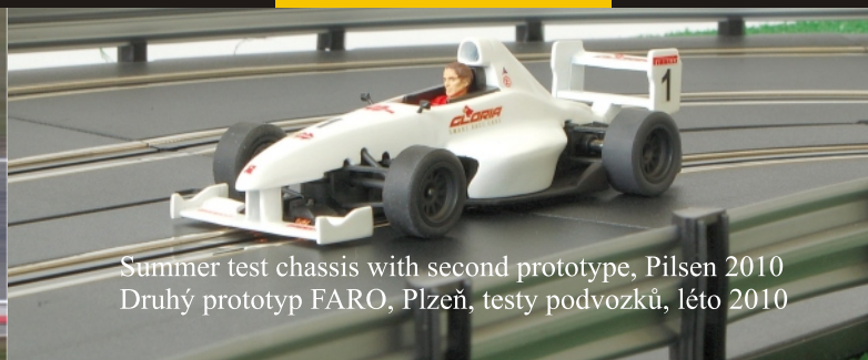
Summer test chassis with second prototype, Pilsen 2010 Druhý prototyp FARO, Plzeň, testy podvozků, léto 2010